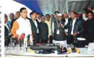
७०० कोटीची उलाहाल

औद्योगिक क्षेत्रासाठी अनुसूचित जातीच्या कंत्राटपट्टी सुद्धा उपलब्ध करून देण्यात येईल, असे ठरविले आहे. तसेच शेतकऱ्यांच्या फायद्यासाठी कृषी क्षेत्रासाठी फायदेशीर ठरतील असे ठरविले आहे. या ठरावाचा अंमलबजावणीसाठी आवश्यक ठरतील उपाययोजना करण्यात येतील.