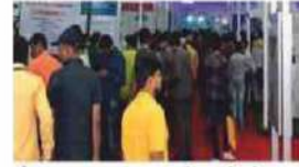
औरंगाबाद : आयसाच्या प्रदर्शनाला भेट देण्यासाठी झालेली गर्दी.